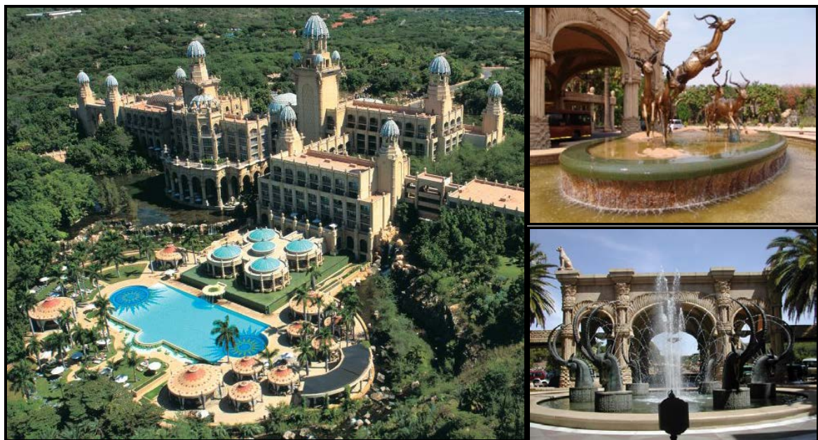
FIGUUR G: 'Palace of the Lost City' deur WATG (Rustenburg, Suid-Afrika), 1990–1992.

Skryf 'n opstel (ten minste EEN bladsy) waarin jy die Klassieke gebou in FIGUUR F met die kontemporêre gebou in FIGUUR G vergelyk. Anders kan jy enige Klassieke gebou met enige kontemporêre gebou wat jy bestudeer het, vergelyk.