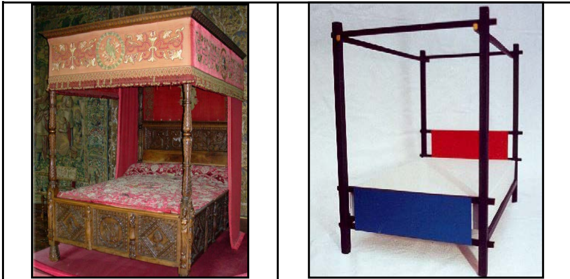
FIGUUR H: Renaissance-bed.