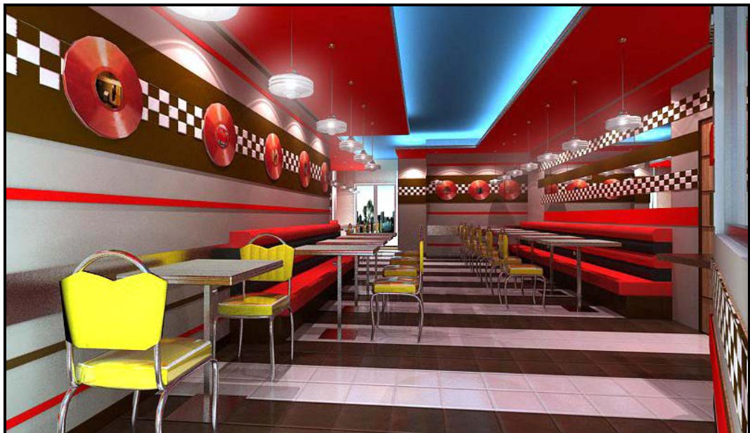
FIGUUR E: Voorgestelde restaurant deur Kylie Shamini (Turkye), 2016.

In 'n opstel (ten minste EEN bladsy) vergelyk die binneontwerp van FIGUUR D met dit van FIGUUR E hierbo.