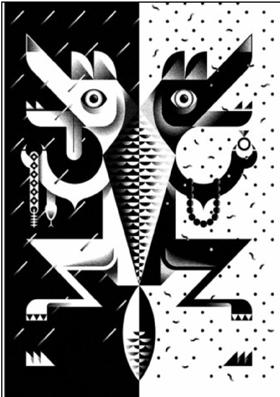
FIGUUR B: How the Birds Chose a King (Hoe die Voëls 'n Koning Gekies Het) (ontwerp-illustrasie) deur Jono Garrett (Johannesburg), 2015.

1.2.1 Analiseer en bespreek die gebruik van die volgende ten opsigte van FIGUUR B: