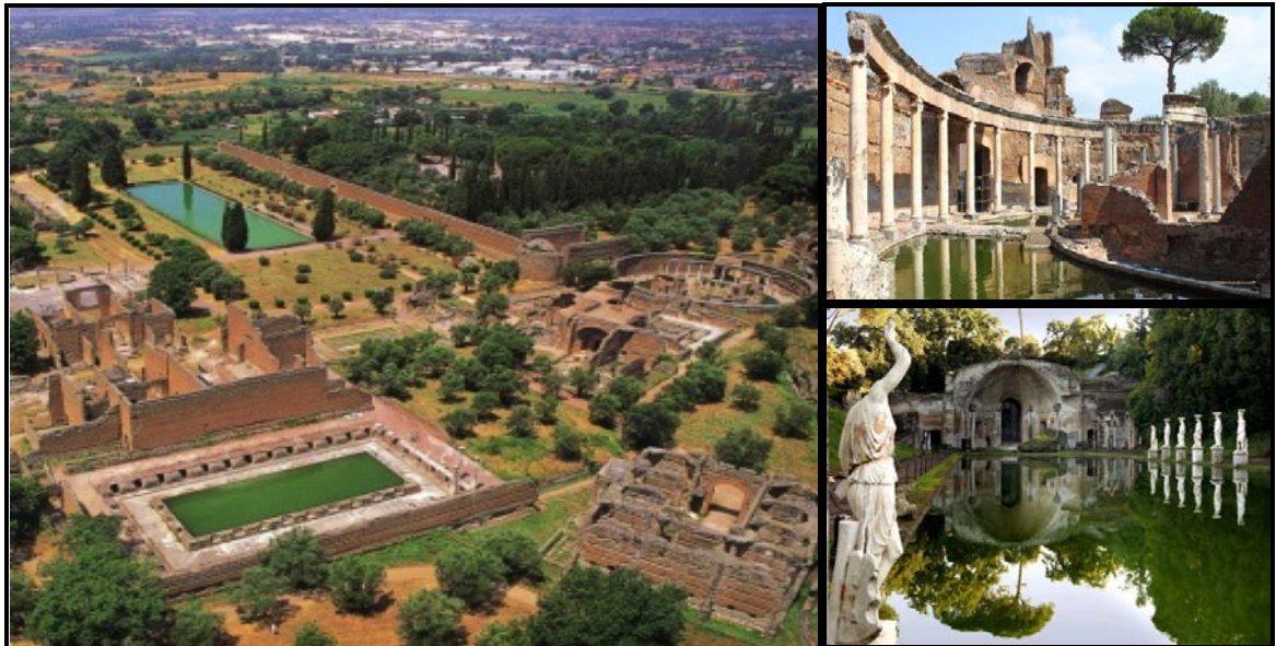
FIGUUR F: Hadrian se Villa , argitek onbekend (Tivoli, Italië), 2 de eeu VHJ.