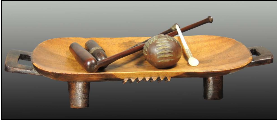
FIGUUR K: Tradisionele Nguni-produkte (Suid-Afrika), 1985.

5.2.1 Dink jy dat die tradisionele produkte in FIGUUR K vandag nog nuttig is? Gee redes vir jou antwoord. (2)