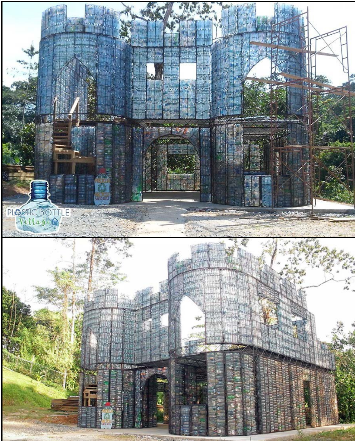
FIGUUR L: Plastiek-dorpshuis deur Isla Colon (Panama), 2016.

Doeltreffende volhoubare ontwerpopplossings voldoen aan die beginsels van sosiale, ekonomiese en ekologiese volhoubaarheid.