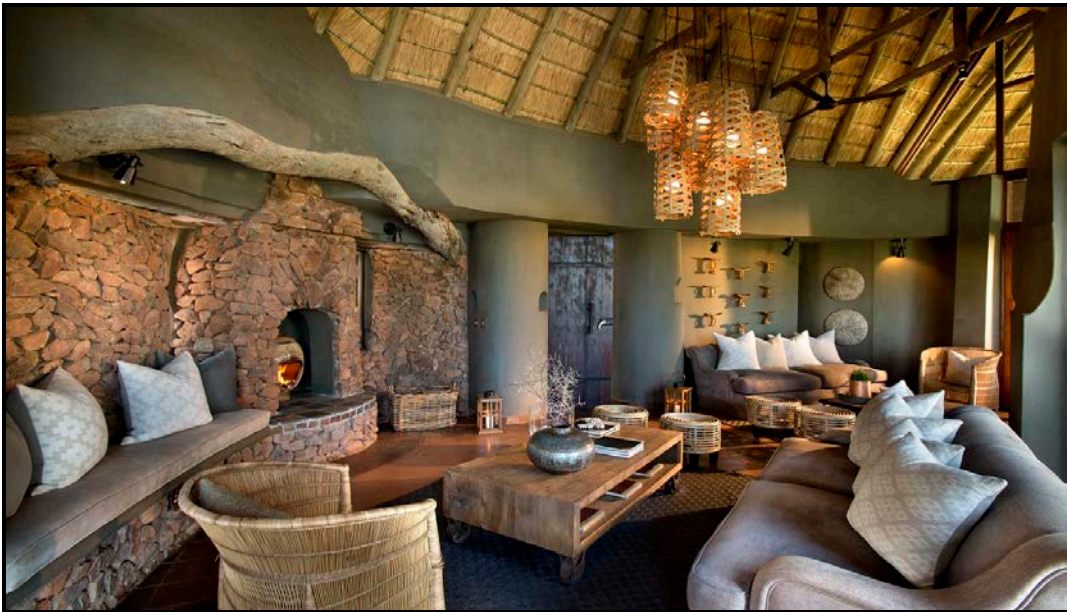
FIGUUR D: Madikwe Safari-lodge deur Rob Marnewick (Nasionale Krugerwildtuin, Suid-Afrika), 2011.