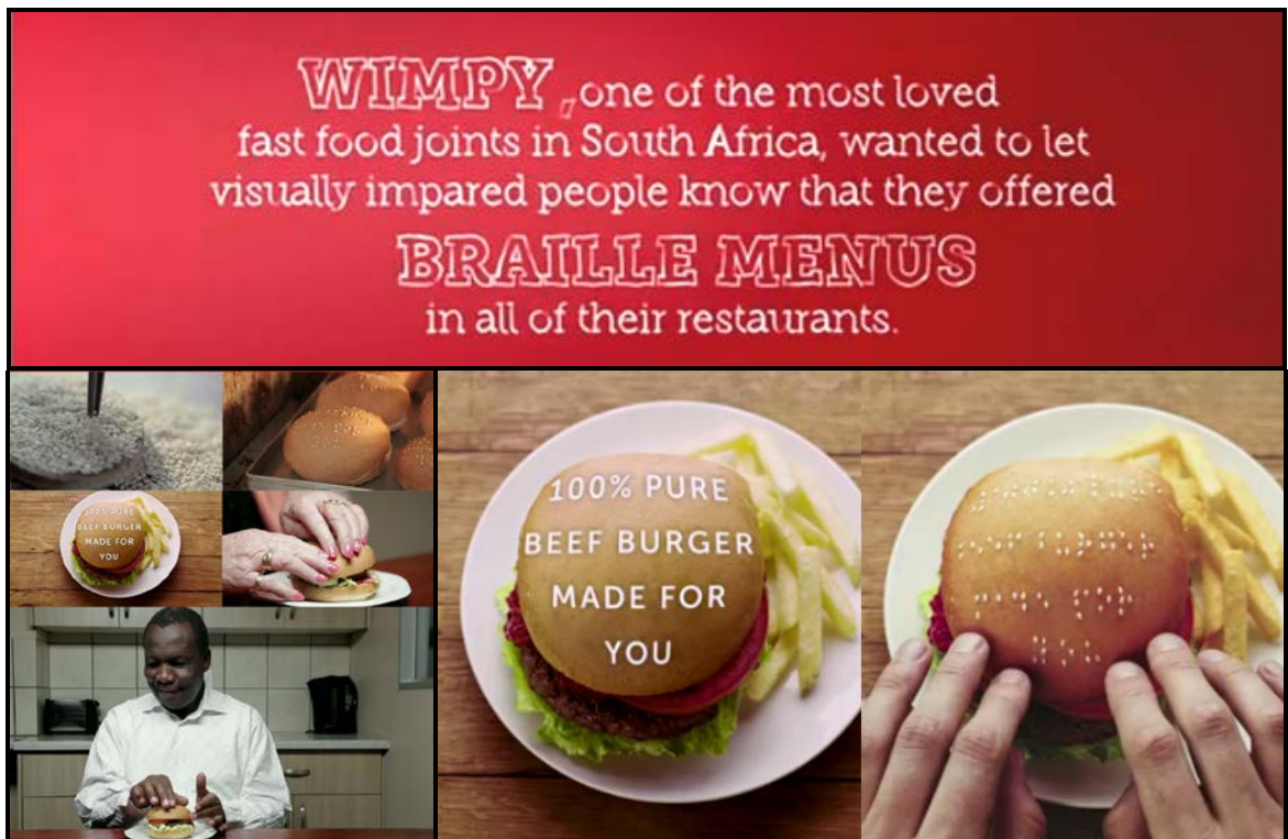
FIGUUR J: Die WimpY Braille-veldtog deur Metropolitan Republic (Suid-Afrika), 2016.